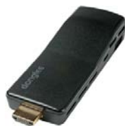
※2 端末および利用イメージ

※1 プッシュ型: お届けしたい情報を donglee 端末に配信すると, テレビ立ち上げ時に自動で「dongleeTV」サービス画面に入力を切替え, ユーザーにお知らせする仕組み